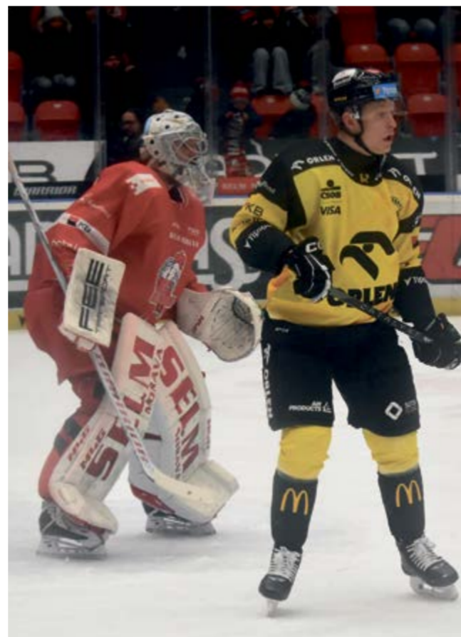
Hokejisté HC Olomouc porazili doma Litvinov a zabodovali na Spartě.

Branky a nahrávky: 3. Hyka (Sobotka), 45. Horák (Hyka, Kemiläinen), 52. Irving (Krejčík), 55. Kemiläinen (Forman), 65. Irving (Krejčík, Chlapík) - 17. Nahodil (Kunc), 20. Fridrich (Svrček, Navrátil), 38. Kunc (Navrátil), 44. Kunc (Svrček, Kohout).