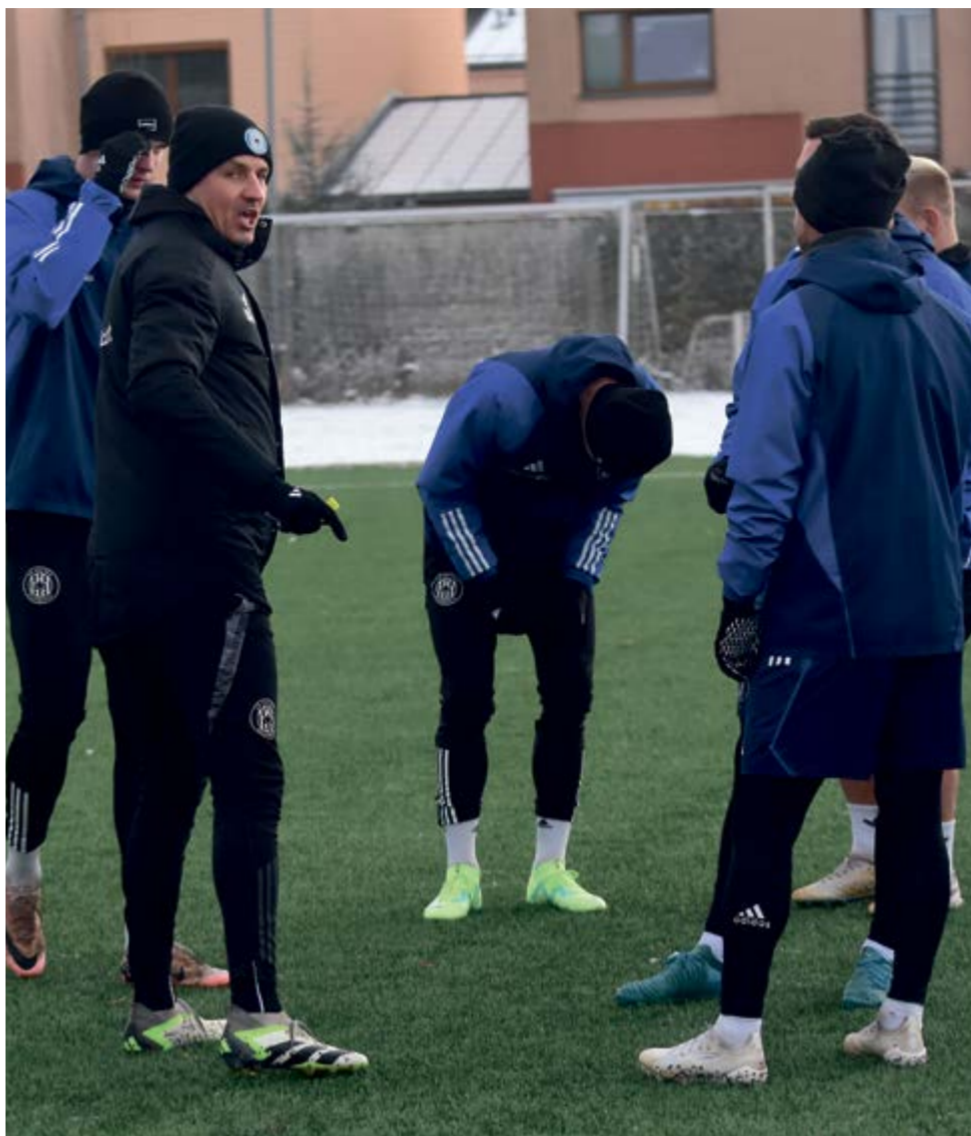
Fotbalisté SK Sigma Olomouc odehrají v přípravě šest zápasů, jen dva z nich doma. Ostatní v cizině.