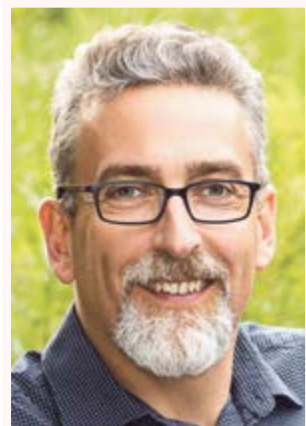
Miroslav Žbánek primátor města Olomouce

Ptejte se vedení města Olomouce na e-mailové adrese otvorenaradnice@hanackyvecernik.cz a my Vaš dotaz necháme zodpovědět!