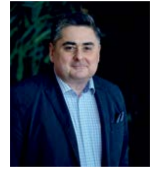
a řízení. ■

Na rozdíl od minulosti, která byla zdlánlivě marginální scénka na zastupitelstvu, jehož hlavním bodem byl rozpočet města na příští rok, posiluje mou dlouhodobou obavu: pozadí snahy o sjednocení divadla s filharmonii není primárně manažerské, nejde jen o snahu o optimalizaci ekonomického fungování instituce. Má i ideologické pozadí, jakousi pomstou „progresivní“ a minoritní umělecké a intelektuální komunity ve městě vůči nenáviděným tradičním kamenným institucím, které chce proměnit k obrazu svému. Protože překonané umělecké formy patří na smetišť dějin a budoucnost patří jen pokrokovému a angažovanému umění. Tento aspekt v pozadí změn může mít na výslednou podobu olomoucké kulturní scény ještě více devastující vliv než případné iracionality institucionálního uspořádání