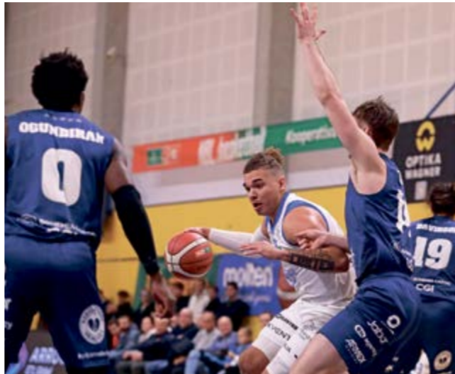
Basketbalisté BK Olomoucko bojují úspěšně o účast ve skupině A1.

na obou stranách hřiště. Chtěli jsme se zbavit té bolesti po zápase se Slavii a jsme rádi, že jsme to zvládli," uvedl trenér BK Olomoucko Andrew Hipsher, kouč BK Olomoucko. ■