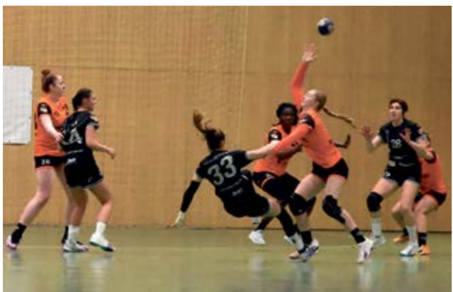
Házenkářky DHK Zora Olomouc porazily Most, to se jim předtím povedlo na jare 2011.