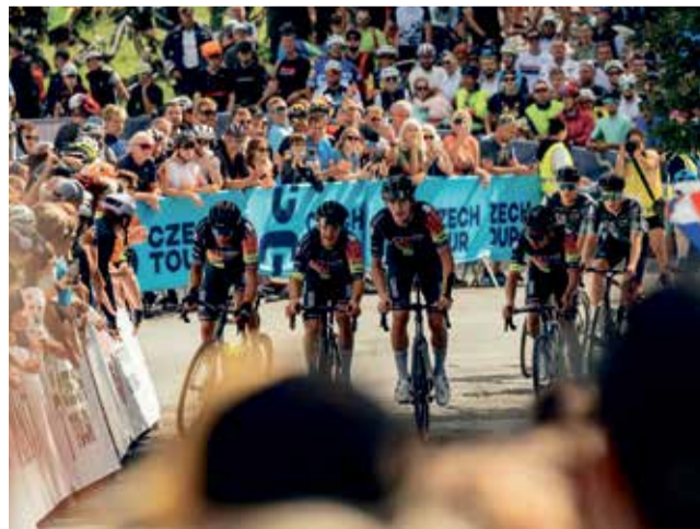
Největší tuzemský cyklistický závod hlásí další skvělé účastníky.

Organizátoři Czech Tour si od účasti těchto tří týmů slibují výrazné oživení startovní listiny. Kombinace inspirativního příběhu, zkušené evropské kvality a mladické dravosti vytváří ideální mix, který může výrazně ovlivnit průběh jednotlivých etap. Potvrzení účasti týmů Novo Nordisk, Caja Rural-Seguros RGA a Red Bull Bora Rookies je dalším důkazem rostoucího renomé tohoto podniku. ■