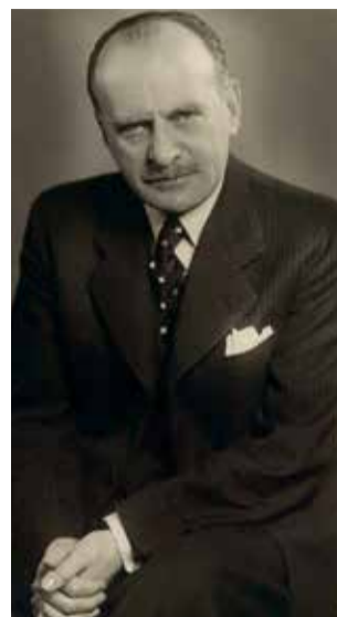
Petr Zenkl, předseda ČSNS a místopředseda vlády v době únorové krize 1948.

Akutní politická krize vypukla poté, co komunistický ministr vnitra Václav Nosek odvolal nekomunistické policejní ředitele v regionech a nahrazoval je věrnými komunisty. Nekomunističtí ministři v reakci podali 20. února 1948 demisi, aby přiměli prezidenta Beneše vládu rozpustit a vypsat nové volby. Petr Zenkl patřil k hlavním iniciátorům tohoto kroku. Zatímco komunisté mobilizovali milice, Zenkl (podobně jako jiní demokraté) v sobotu 21. února odjel na plánovanou mítníky v regionech. Ironické komentáře k cestě do Lanškrouna, kde měl převzít české občanství, a poté na Moravu pronikly dokonce do komunistického propagandistického seriálu Gottwald, v němž Zenkla ztvárnil Otakar Brousek. Jede za milenkou Androvou, mohl si na