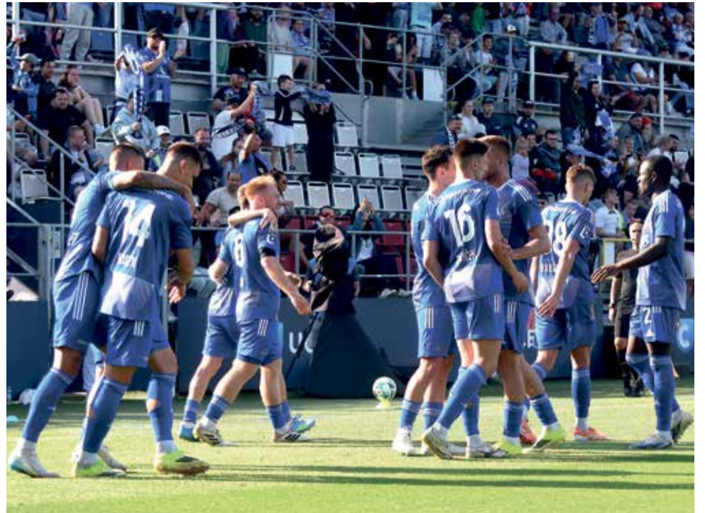
Fotbalisté SK Sigma Olomouc i přes domácí prohru postoupili do finále.

Ve finále nadstavbové skupiny o 7.-10. místo čeká Sigmu Karviná, která v neděli také v prodloužení přetlačila Pardubice. První zápas se bude hrát na půdě Slezanů v sobotu 16. května od 17:00, odvěta na Andrově stadionu pak v sobotu 23. května od 14 hodin. ■