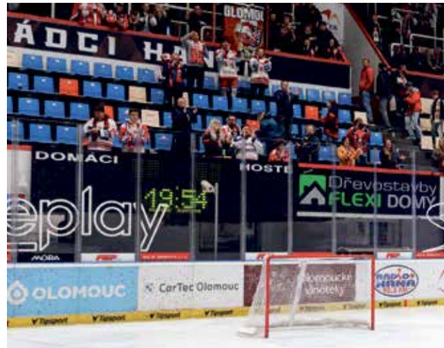
Hokejisté HC Olomouc zahájili přípravu na novou extraligovou sezonu.